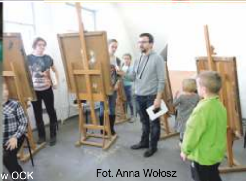
Ferie w OCK