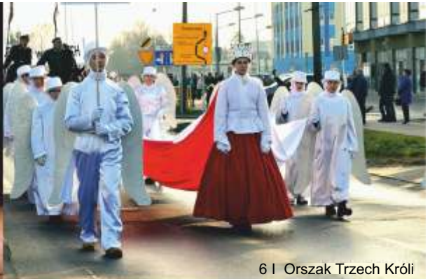
6 | Orszak Trzech Króli