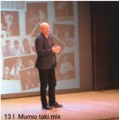
13 | Mumio taki mix