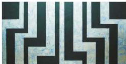
Roman Borawski - Kompozycja 8

Wystawa Romana Borawskiego i Przemysława Karwowskiego, artystów plastyków z Łomży uprawiających malarstwo abstrakcyjne. Roman Borawski prezentuje zestaw obrazów zatytułowany „Gold, Silver & Copper”, który jest kontynuacją, rozpoczętego w 2003 roku cyklu „Kody, znaki, totemy”. Spoiwem łączącym wszystkie prace wystawy są metaliczne farby w trzech tytułowych barwach.