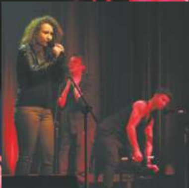
II Nagroda (pios. autorska) - Grupa Macieź