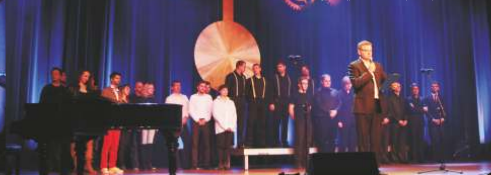
I Nagroda (pios. autorska) - Kabaret No! Nejm